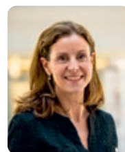
Charlotte Parmentier-Lecocq, ministre déléguée aux Personnes handicapées auprès du ministre des Solidarités