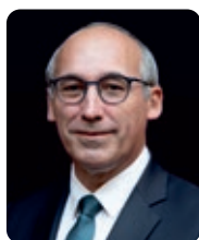
Paul Christophe, ministre des Solidarités, de l’Autonomie et de l’Egalité entre les Femmes et les Hommes