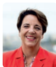
Agnès Canayer, ministre chargée de la Famille et de la Petite Enfance