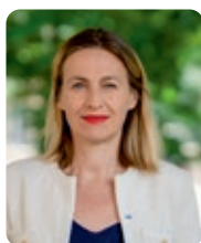
Astrid Panosyan-Bouvet, ministre du Travail et de l’Emploi