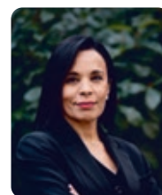
Salima Saa, secrétaire d’Etat chargée de l’Egalité entre les Femmes et les Hommes