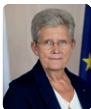
Geneviève Darrieussecq, ministre de la Santé et de l’Accès aux soins